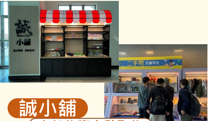
誠小舖 上架物資自助取物