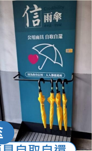
信雨傘 公用雨具自取自還