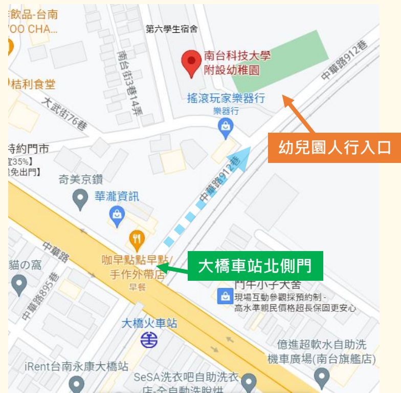
台南市公車市區21路入校動線及停靠站圖