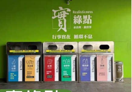
實綠點 落實前端細緻分類