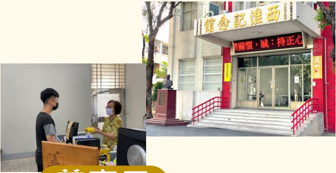
義窗口 失物招領、二手物交流